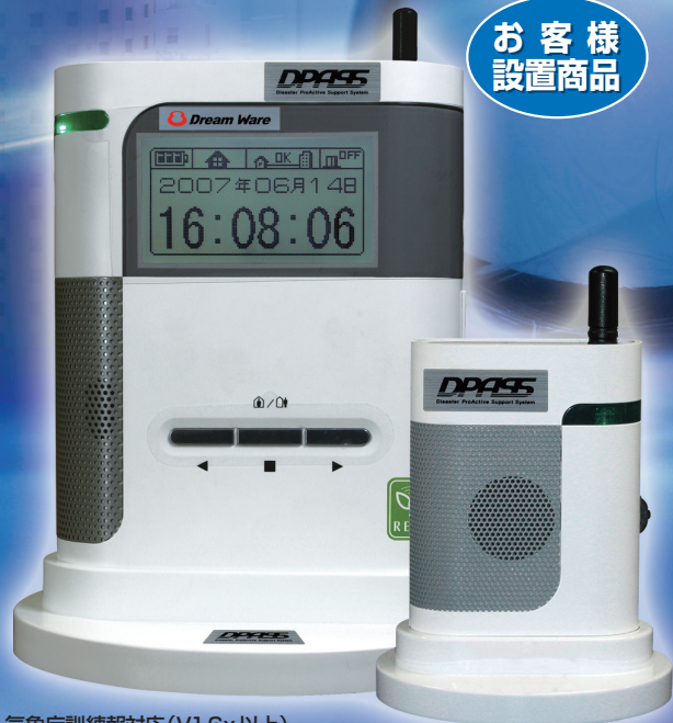
気象庁訓練報対応 (V1.6x以上)