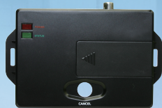
● DPASS拡張ユニット SH210-J-O (オープン価格)

緊急地震速報を受信すると、この機器の設置された場所での震度、地震の到達時間を利用者に報知します。地震到達までの限られた時間内に利用者の身の安全確保に役立たせるのが目的です。